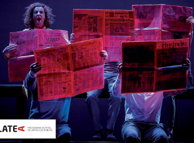
PLATE PROGRAMA ESTADAL DE ARTES ESCÉNICAS