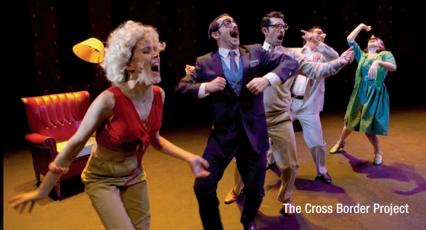
The Cross Border Project

Organizan: Concejalía de Cultura y Educación / Red de Teatros de Castilla y León Edad recomendada: a partir de 5 años - Duración: 60 min. Precio: 3 €