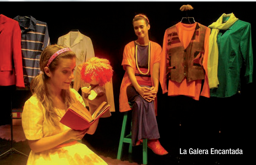
La Galera Encantada