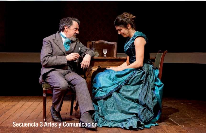
Secuencia 3 Artes y Comunicación