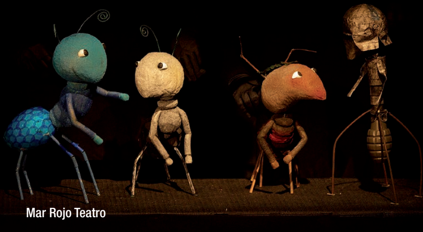
Mar Rojo Teatro